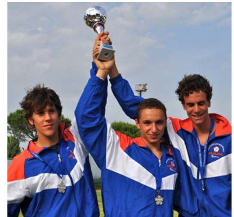
La squadra RAGAZZI 2^ class. ai Campionati Italiani